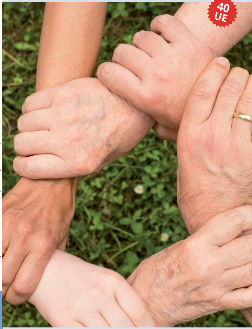
Gestaltung: fresh-concept.com